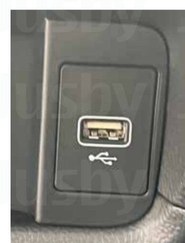
純正装着 USB ポート