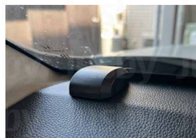
GPS アンテナ ダッシュボードに設置

※社外ナビ&ディスプレイオーディオ接続の参考用の配線図です。ハーネスカラー等は一般的な信号色で説明しております 実際の機種や使用ハーネスにより異なる場合があります。必ず機器やハーネスの取説を参考に装着をお願いします